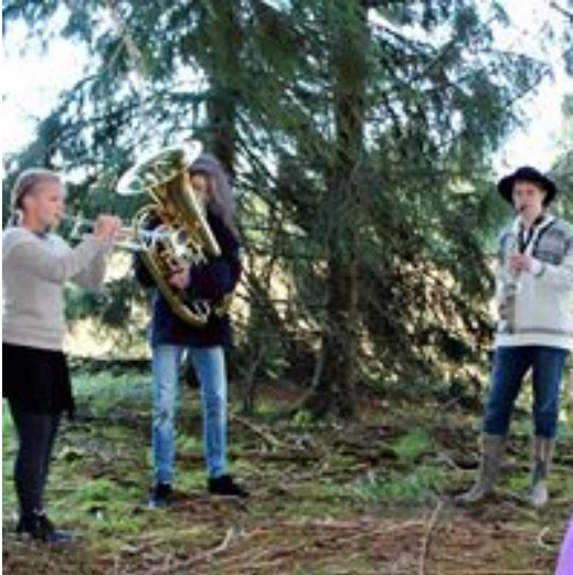
Midtkammer bygninger under Vegalangs

Midtkammerbygninger finnes i alle bygder østafjells, og på Rømerike er de svært vanlige. I Vormadalen er de flere og større enn i andre områder. Dens amlinga av store, gamle, velholdte gardbygninger er en viktig del av vår felles kulturarv i Nes. Under Vegalangs i Vormadalen vil vi gjerne vise fram noe av denne kulturarven. Alle de fem besøkgårdene har midtkammerbygninger – kuser, Veset, Hofseth Søndre,