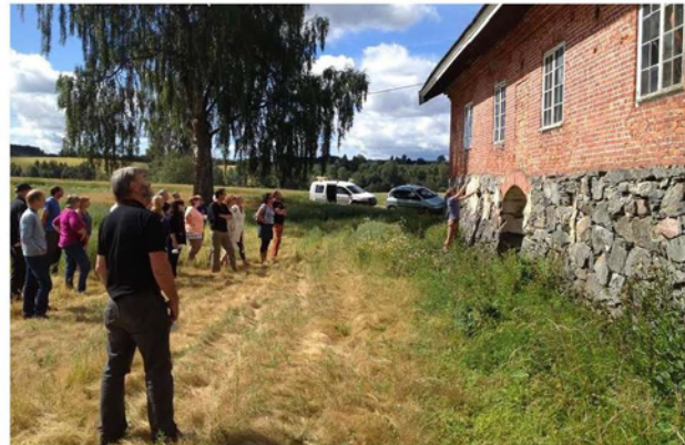
Eldre uthus: Bevaring, istandsetting, nye teknologiløsninger og bruk